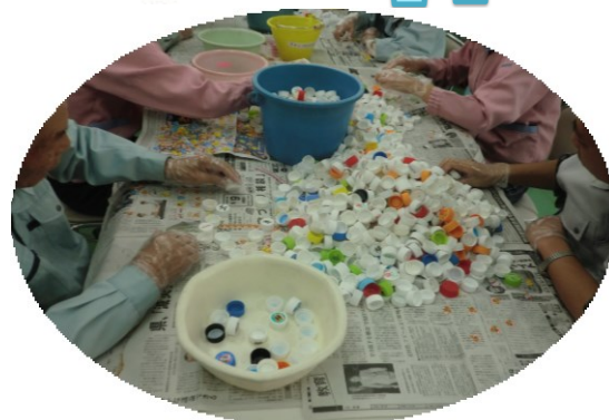
キャップの色分け・異物除去作業

キャップのリサイクルで重要な 色分け・異物除去は 手作業なんだよ。 作業中にケガしないように、 どうかみなさん、協力してね!!