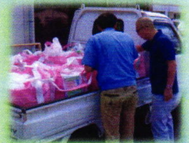
施設スタッフさんも大活躍です