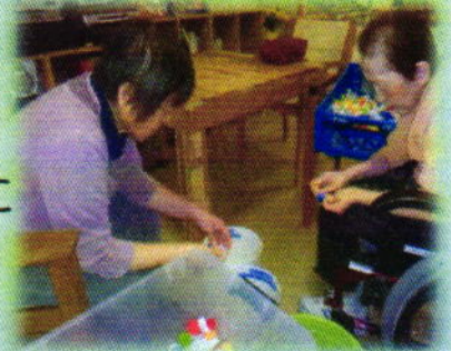
目標を決めてがんばってます

おかげさまで、エコキャップの量が増え続けています。そこで従来の障がい者の方々のお仕事支援に加え、介護老人福祉施設をご利用になっているお年寄りの方々に キャップの色分けなどの活動 をやって頂くことになり2015年11月からスタート！！